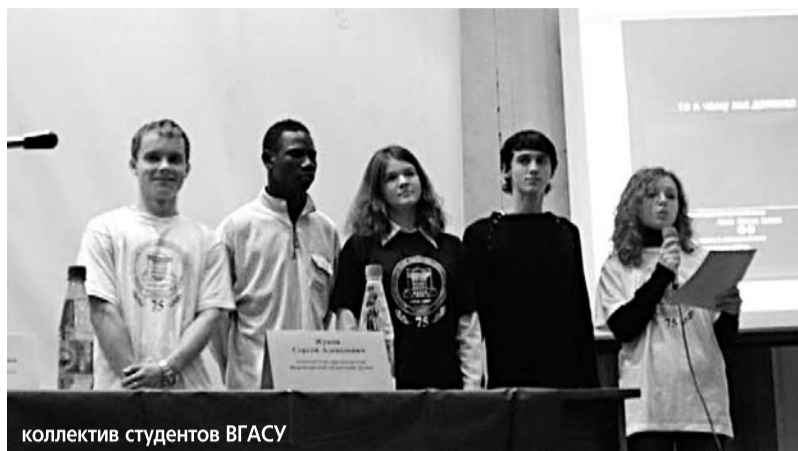
коллектив студентов ВГАСУ

Номинация «Лучшая пресс-служба (лучшая PR-компания): ОАО «Оскольский электрометаллургический комбинат»; Белгородский филиал ОАО «ЦентрТелеком»; РОА «Общественная Палата Воронежской области».